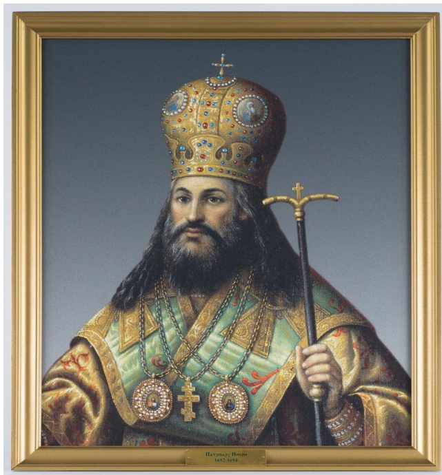
Рис. 1 Патриарх Никон